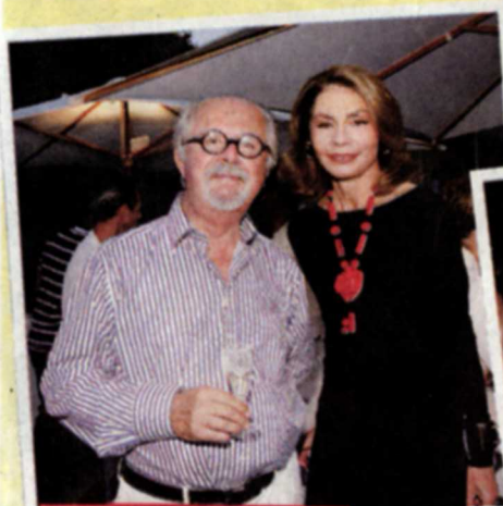
Fernando Botero con la moglie Sophia Vari