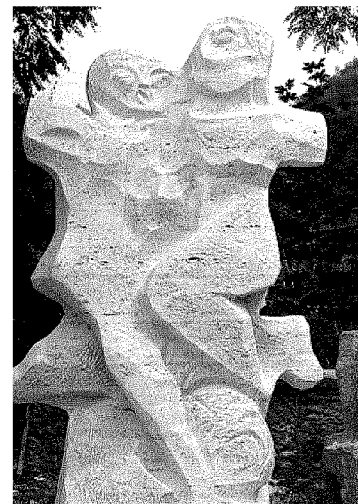
"I calciatori" di Ugio Guidi