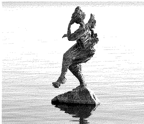
Sopra una delle sculture in bronzo di Brixel, accanto un'opera di Marcello Veneziani

Fortino in Piazza Garibaldi o ai numeri 0584 280292 - 0584 280253; fax 0584 280248 forteinfo@comunefdm.it ; forte.info@comunefdm.it.