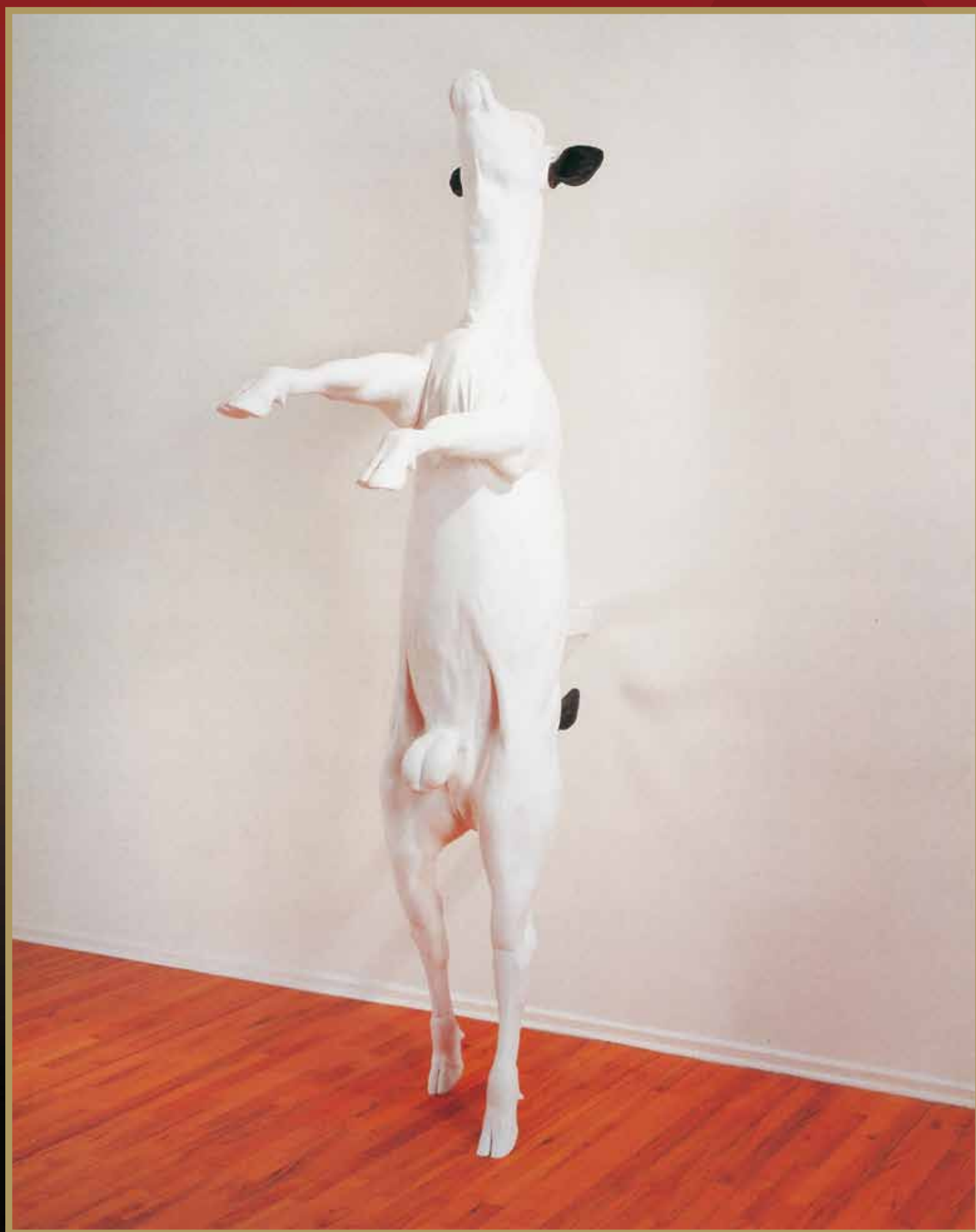
Not Vital - L'après-midi de Nijinsky , 1993-95