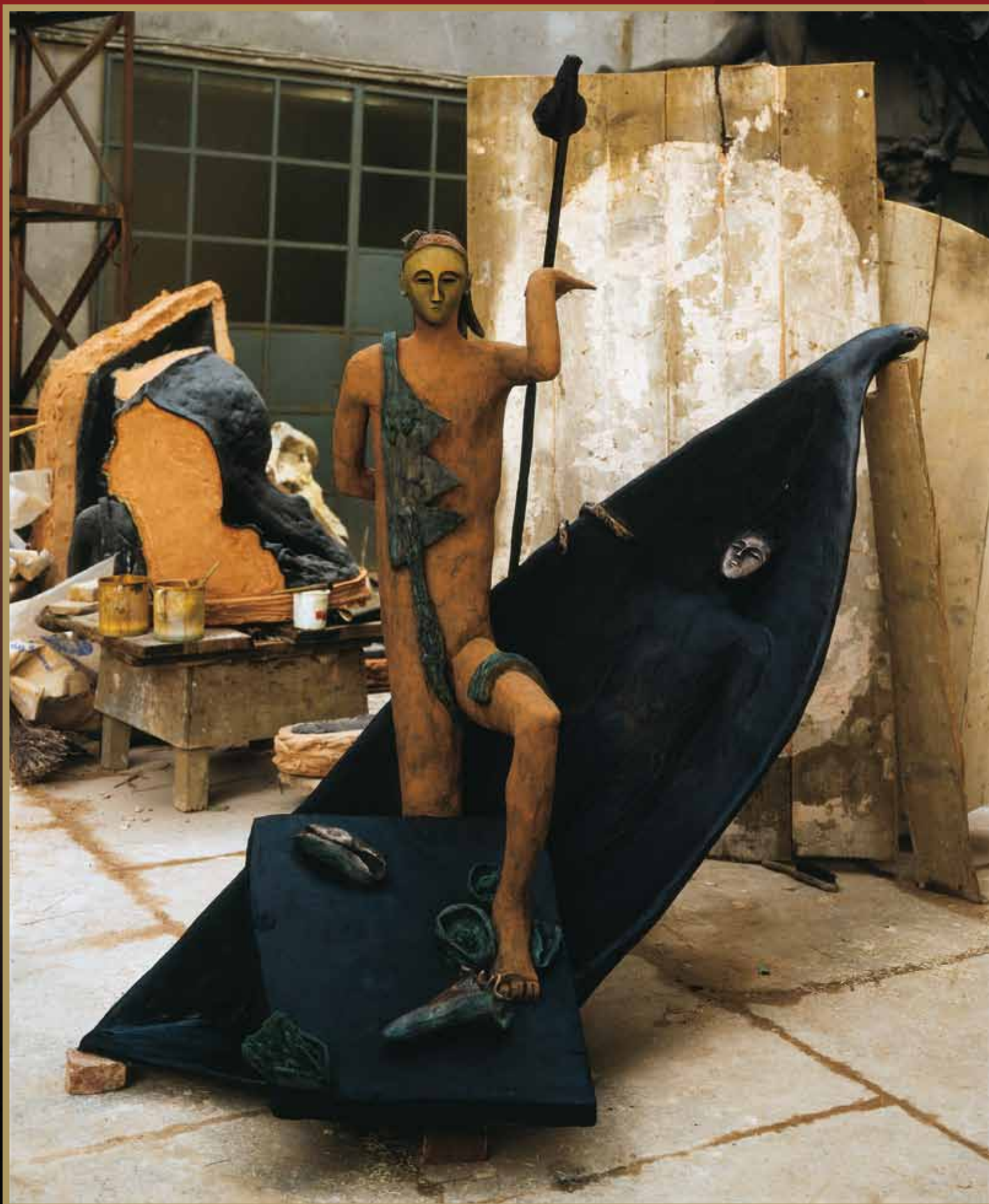
Mimmo Paladino - Giardino chiuso , 1982