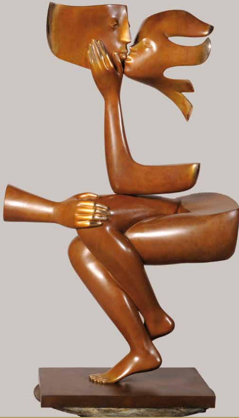
Etienne - Le baiser , 2008