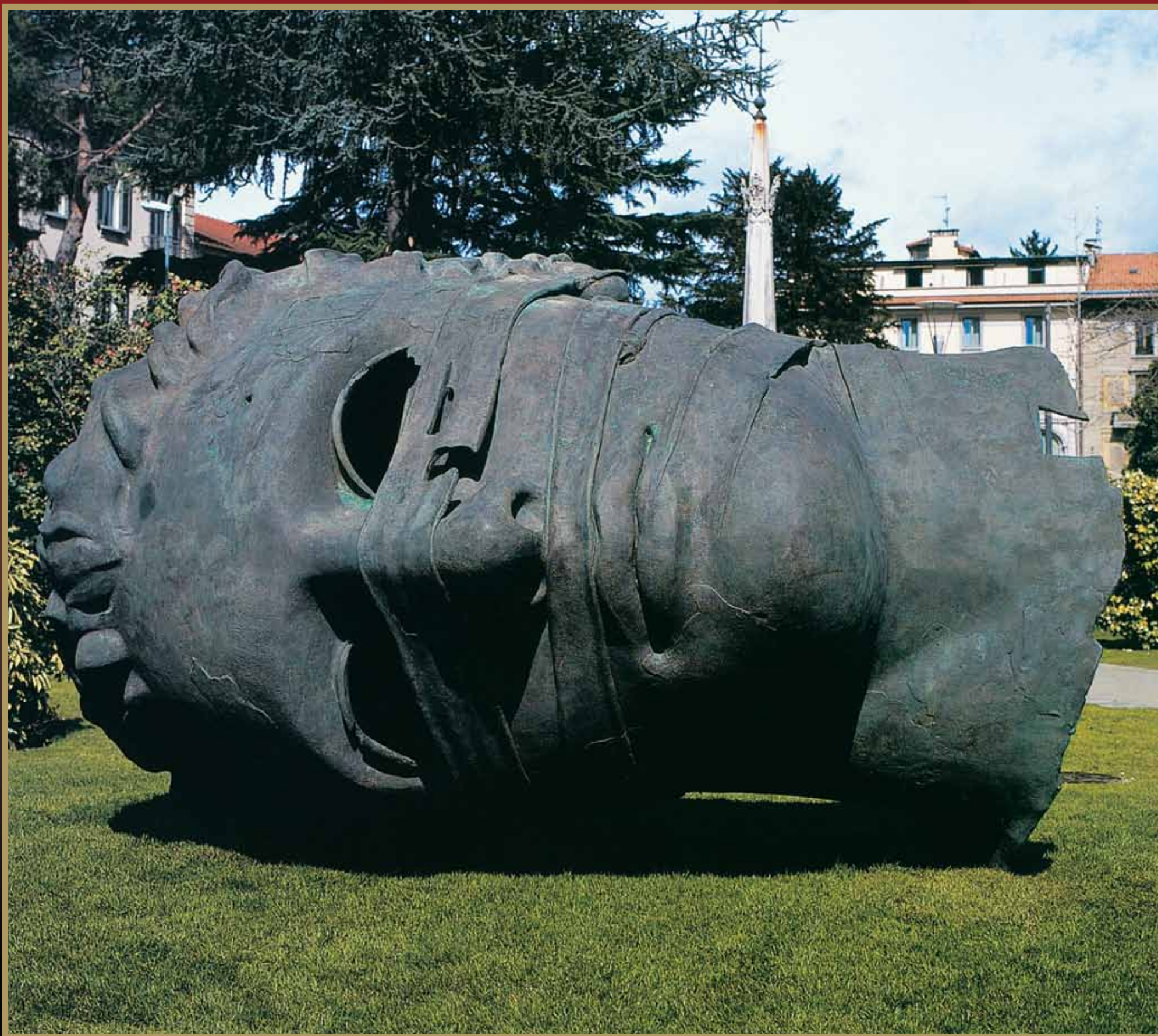
Igor Mitoraj - Eros bendato